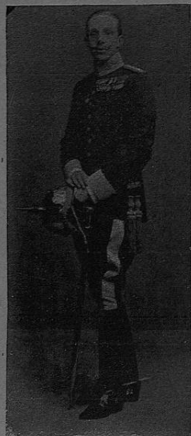
S. M. Don Alfonso XIII Rey de España