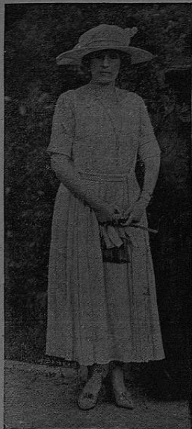
S. M. Doña Victoria Eugenia Reina de España

Hoy la figura de don Alfonso está despertando en América gran interés por su proyectado viaje, y porque su persona constituye el eslabón que uni-