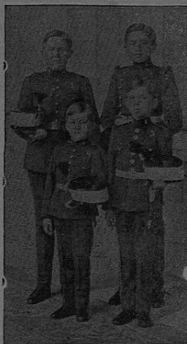
Ss. As. Rs. los Infantes de España